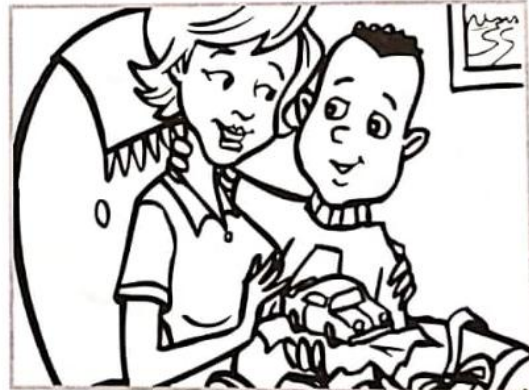
“Gracias por el regalo”.