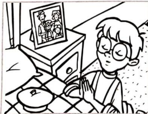
“Gracias por mi familia”.