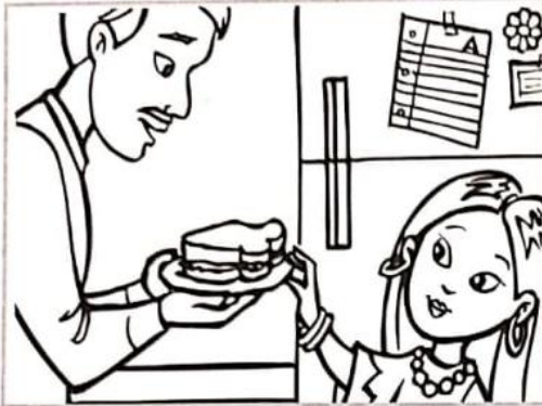
“Gracias, papá, por prepararme el almuerzo”.

6. Colorea cada cuadro que muestre agradecimiento y traza una X sobre los que no lo muestran