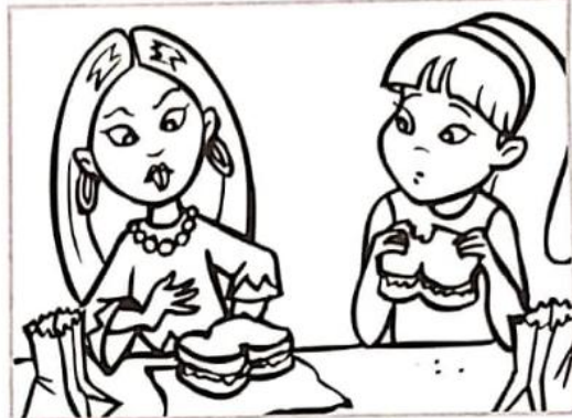
“Este sándwich está horrible”.