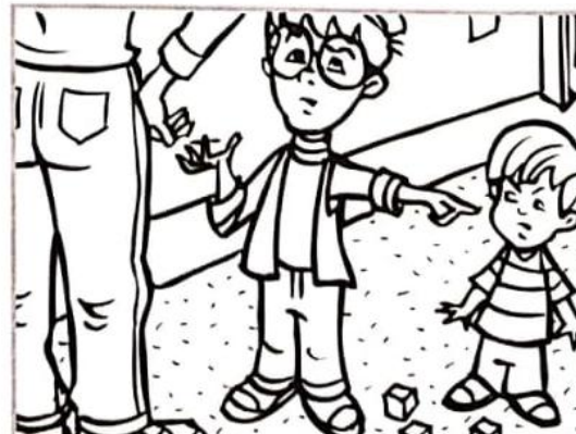
“Mi hermano siempre me está molestando”.

El prado de Kingsley. Actividades y diversión. Grandes virtudes pág 30