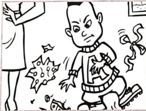
“No me gusta este regalo”.